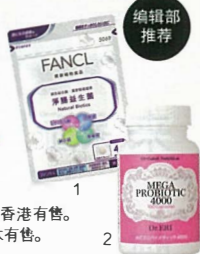
1.FANCL清肠纤维 中国香港有售。 2.DR.ERI肠道调节片 日本有售。