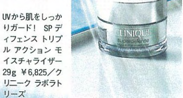
UVから肌をしっかりガード! SPデフイェンストリブル アクション モイスチャライザー 29g ¥6,825/クリニク ラボラトリーズ

今、皮膚医学界で新たな標準化の動きあり! ご存じの通り、現在紫外線防御力を示すのが、SPF値。それに加えて、免疫システム保護理論=IPFという、肌の免疫力を考え入れた保護指数が今後表示される見込み。その研究は現在も進行中。UV対策も、より強力に。