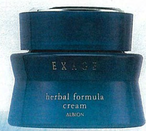
中国4000年の漢方生薬「冬虫夏草」配合の注目商品。エクサーージュ ハーバルフォーミュラ クリーム 40g ¥6,300/アルピオン

蚕の糸のたんぱく質を利用したコスメの開発がすでに行われているなど、昆虫の持つパワーに注目したアイテムが席卷しそうなこれからの美容界。動物、海洋、植物の次は、いよいよ昆虫由来成分の時代の到来。彼らの持つ未知のチカラが、女性の肌を救う!