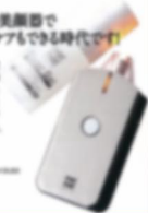
LED光療デバイス 価格 ¥10,000

LED光療 Light & Heat Energy 効果の皮膚科治療のノウハウが凝縮されたデバイスで、効果も高くなりセルフケアの時代です。効果も高くなりセルフケアの時代です。効果も高くなりセルフケアの時代です。