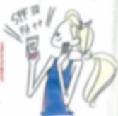
紫外線・紫外線吸収率の比較